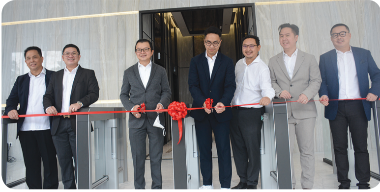
Direksi dan komisaris Trinita Dinamik Group melakukan penguntingan pita Opening Grand Lobby The SMITH.