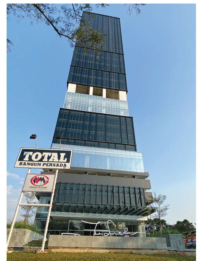
The SMITHOffice, SOHO & Residence.