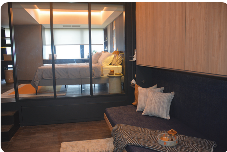
Show unit The SMITHOffice, SOHO & Residence.

sky lounge, gaming room dan satu lantai, khusus dipersiapkan untuk coworking space.