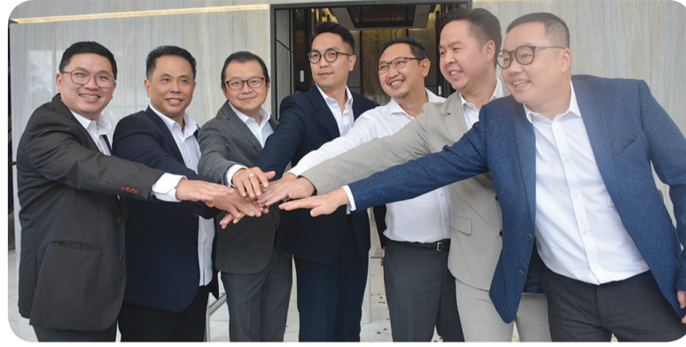
Direksi dan komisaris Trinita Dinamik Group berfoto bersama.

ALAM SUTERA - Pengembang real estate dan properti yang sedang berkembang pesat di kawasan Alam Sutera, Trinita Dinamik Group menyelesaikan pembangunan proyek terbarunya, The SMITHOffice, SOHO & Residence.