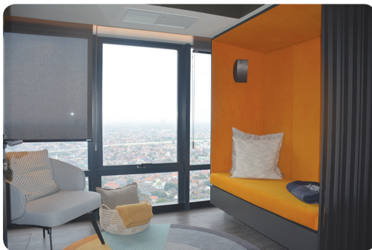
Show unit The SMITHOffice, SOHO & Residence.